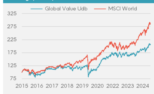
Udvikling i porteføljens afkast versus benchmark siden start

Rådgiver for Investeringsforeningen Great Dane